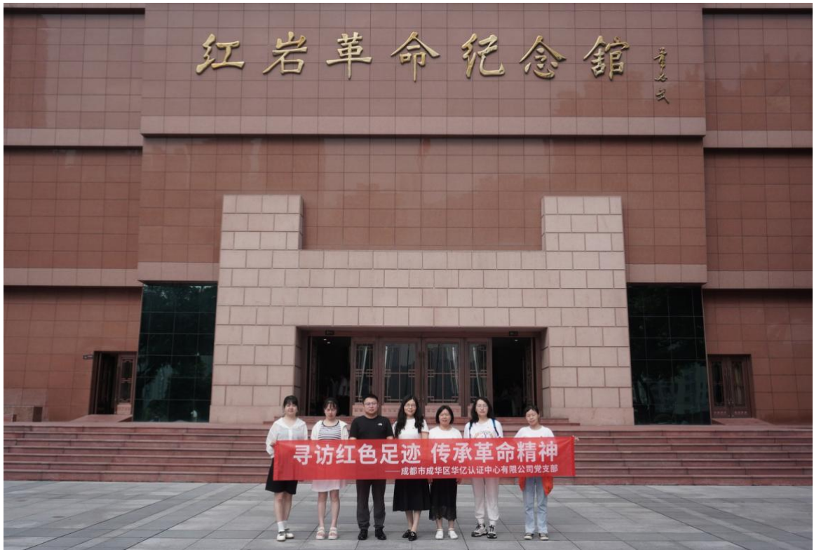
2024年6月底参观红岩革命纪念馆和渣滓洞