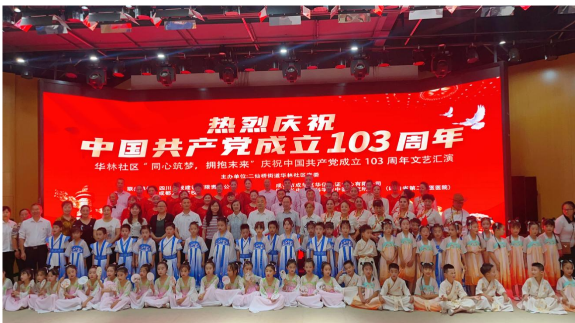
2024年参加社区庆祝中国共产党成立103周年文艺汇演