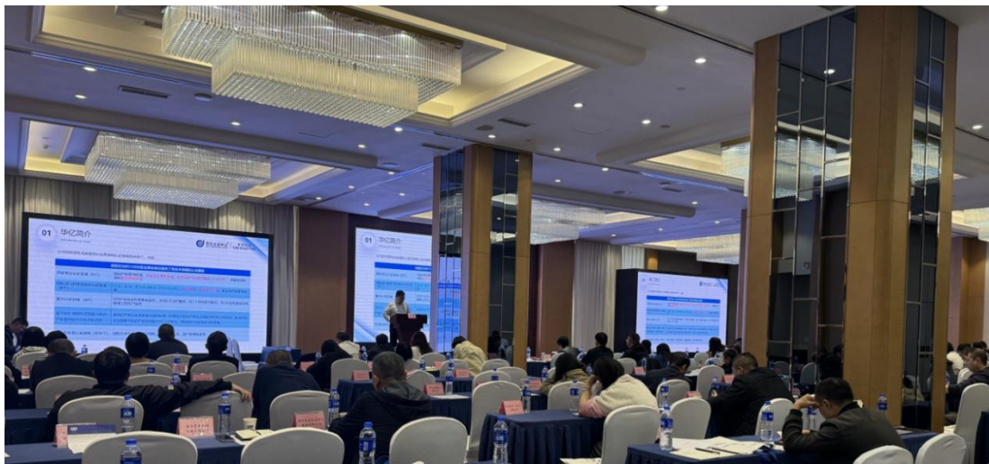
2024.10.31 乐山市 2024 年企业知识产权专题培训