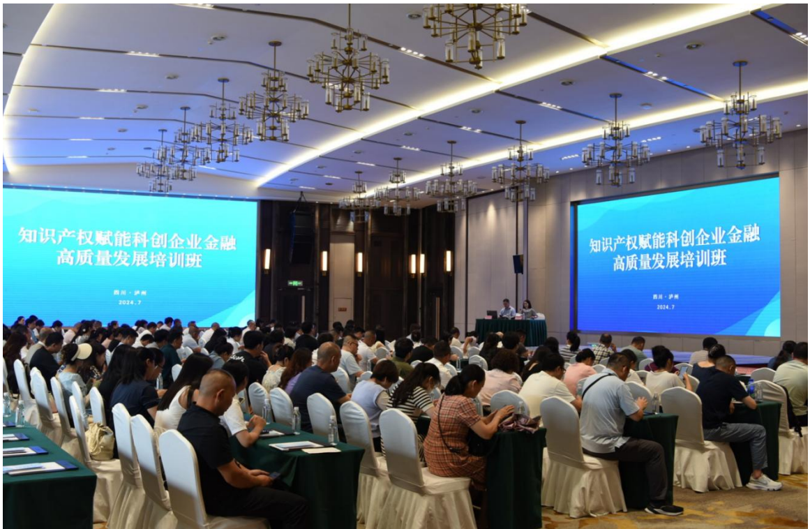
2024.07.08 泸州 “知识产权赋能科创企业金融高质量发展培训班”培训