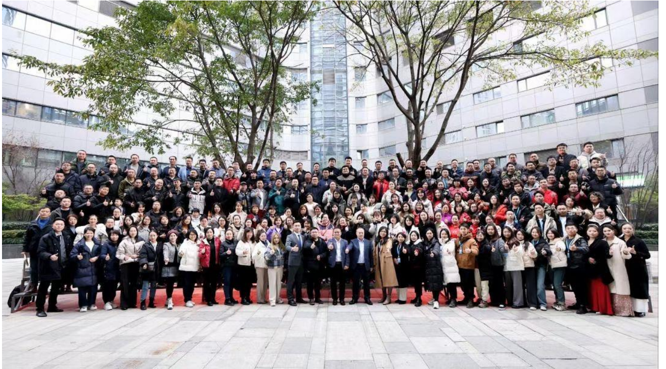
2024.1.5 公司成立六周年年会